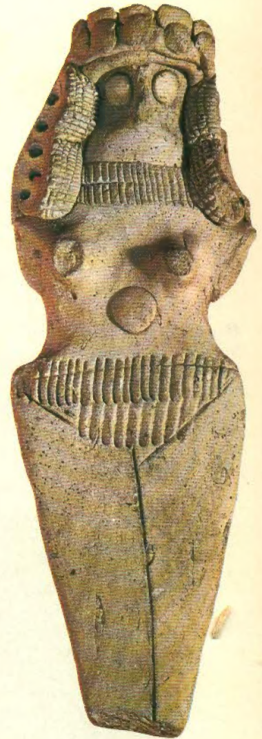
Representación de Ishtar, diosa del amor y la fecundidad, pero también de la guerra, que tuvo un lugar muy importante en la religión mesopotámica (Museo del Louvre, París).

El lector interpretará esta referencia a los hombres de cabeza negra como extranjeros también aceptados por Marduk; éstos eran los semitas. Muy probablemente venían de Arabia, que debió de secarse también al acabar el último período glacial,